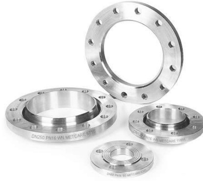
Plate Flange Welding Neck Flange Threaded Flange Blind Flange Lapped/Loose Flange